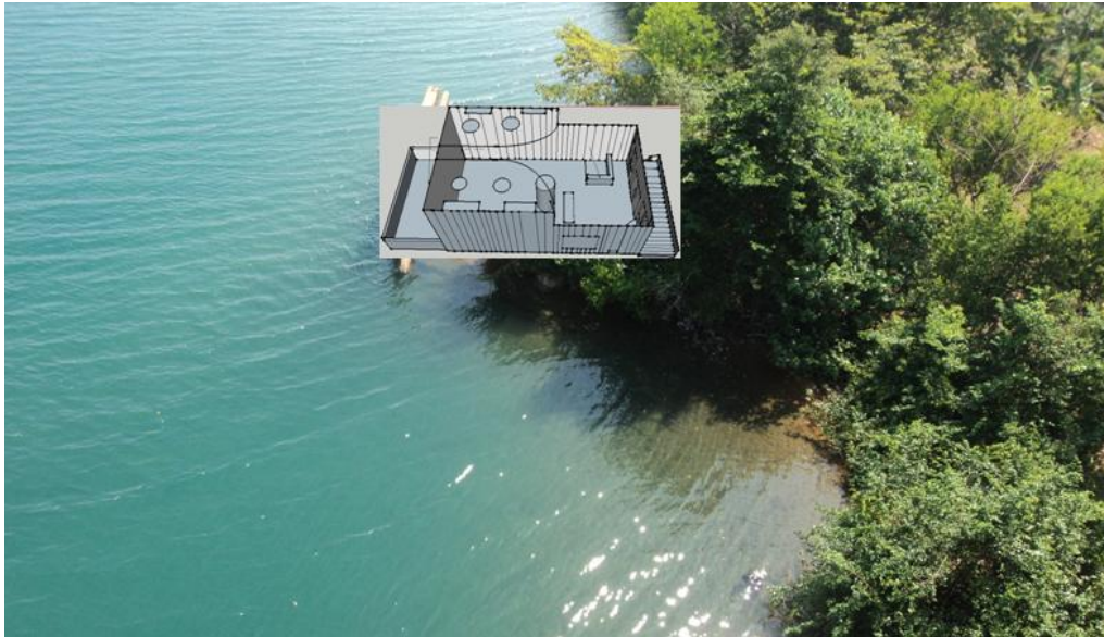
IMAGEN 2: DISEÑO DE CENTRO SOBRE FOTO DEL TERRENO EN EL CUAL SE DESEA CONSTRUIR