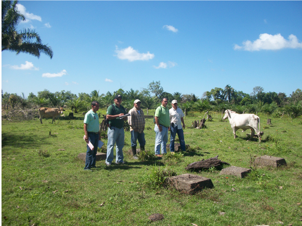
Foto donde se observa los canales de desagüe revestidos de concreto construidos por la Tela Rail Road Company.

Foto del lote solicitado, se observan potreros para ganadería, palma africana al fondo y las bases de cemento de las viviendas de la Tela Rail Road Company.