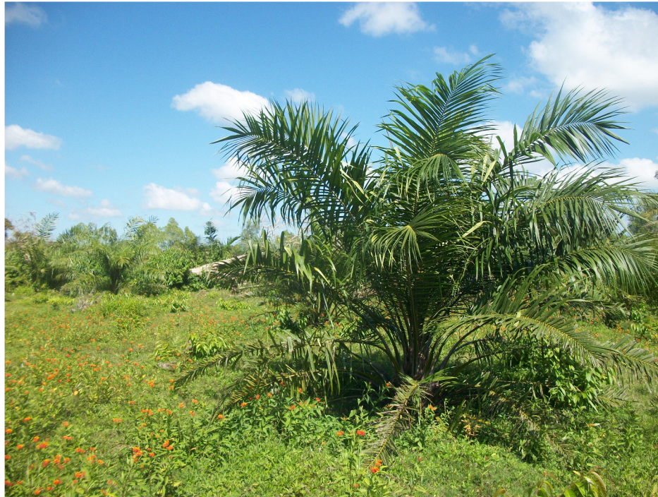
Foto del lote solicitado donde se observa que esta intervenido hace muchos años.

Plantación de palma africana en el lote solicitado por el Señor Ulises Osorio