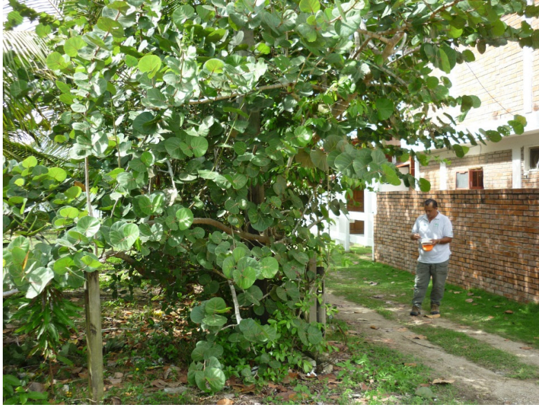
Vivienda que limita con proyecto Playa Escondida