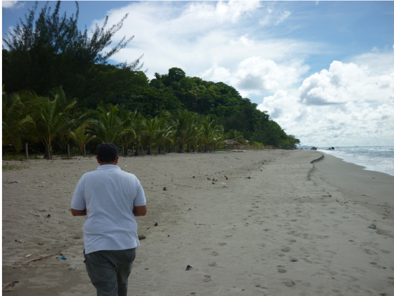
Imagen donde se observa vegetación en el área a desarrollar el proyecto

Imagen donde se observa la distancia de la propiedad a la última ola y al fondo se observa el cerro Triunfo de la Cruz