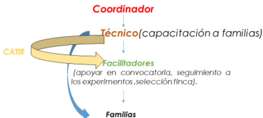
Figura 2. Esquema de transferencia de tecnología del a las familias ganaderas a través de la metodología de ECAs.

Una vez que los participantes conocen los objetivos del taller, se toman las decisiones respecto a las normas del taller, esto con el objetivo de mantener el orden durante el desarrollo del mismo. De esta forma a través de una lluvia de ideas de acuerda: